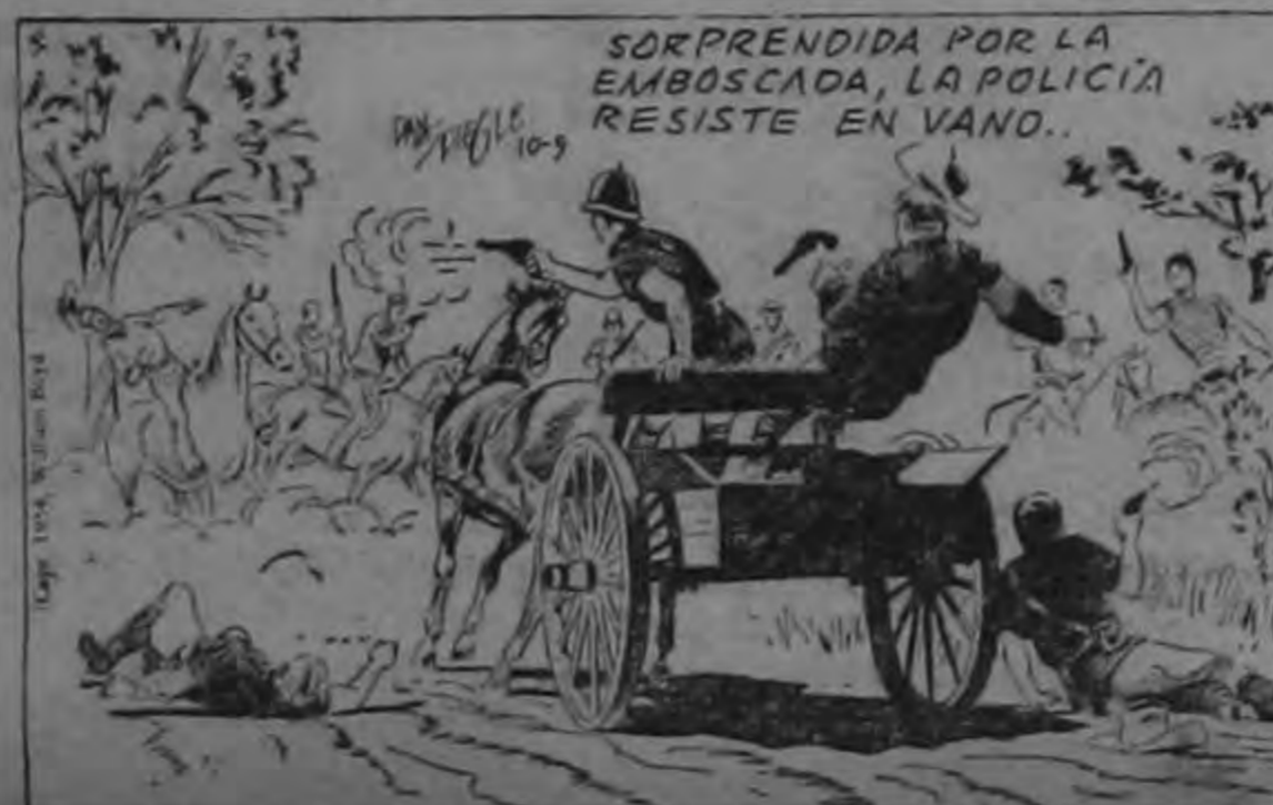
SORPRENDIDA POR LA EMBOSCADA, LA POLICIA RESISTE EN VANO.