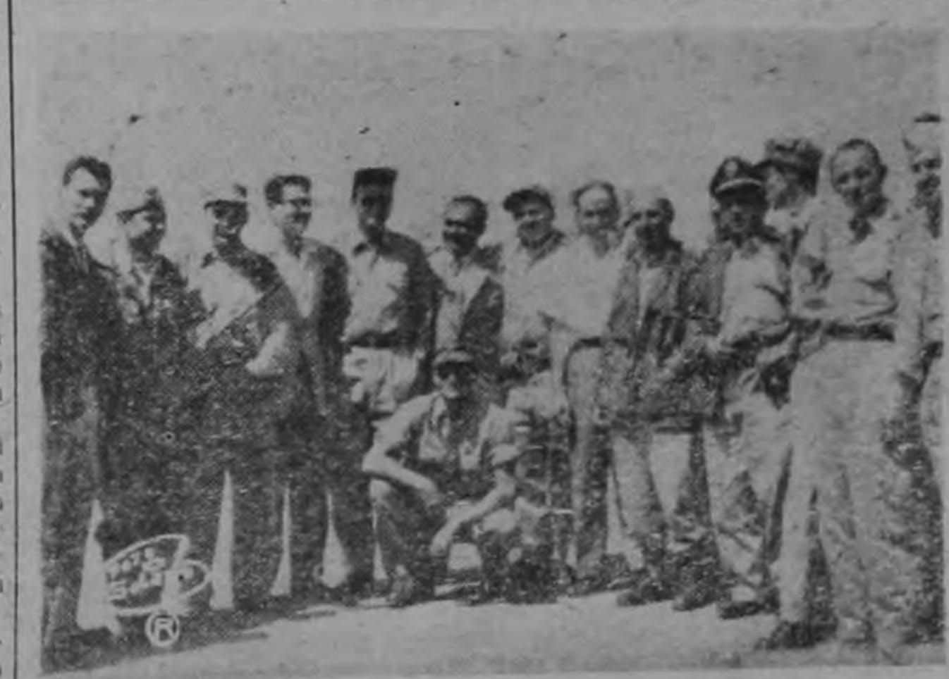
LISTOS PARA LA ACCION. — Antes de partir del Aeropuerto hacia Los Chiles un grupo de voluntarios posa para este periódico en compañía de altos jefes militares.

ARTICULO I. Se leyó y aprobó el acta de la sesión anterior. ARTICULO II. —Ante la agresión armada de que, en forma vandálica ha sido objeto el país, por parte de mercenarios extranjeros y algunos malos costarricenses quienes sin escrúpulos de ninguna índole han ametrallado ciudades abiertas y atentado contra un régimen eminentemente representativo y democrático. SE ACUERDA: 1°) Ratificar al Presidente de la República don José Figueres el voto de confianza que esta Municipalidad le brindara hace alrededor de tres meses, por su magnífica gestión administrativa; 2°) Expresarle la confianza de esta Corporación por la forma ponderada pero enérgica en que ha actuado el Gobierno frente a la actual emergencia bélica; y 3°) Contribuir con la