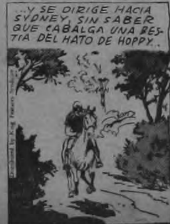
...Y SE DIRIGE HACIA SYDNEY, SIN SABER QUE CABALGA UNA BESTIA DEL HATO DE HOPPY.