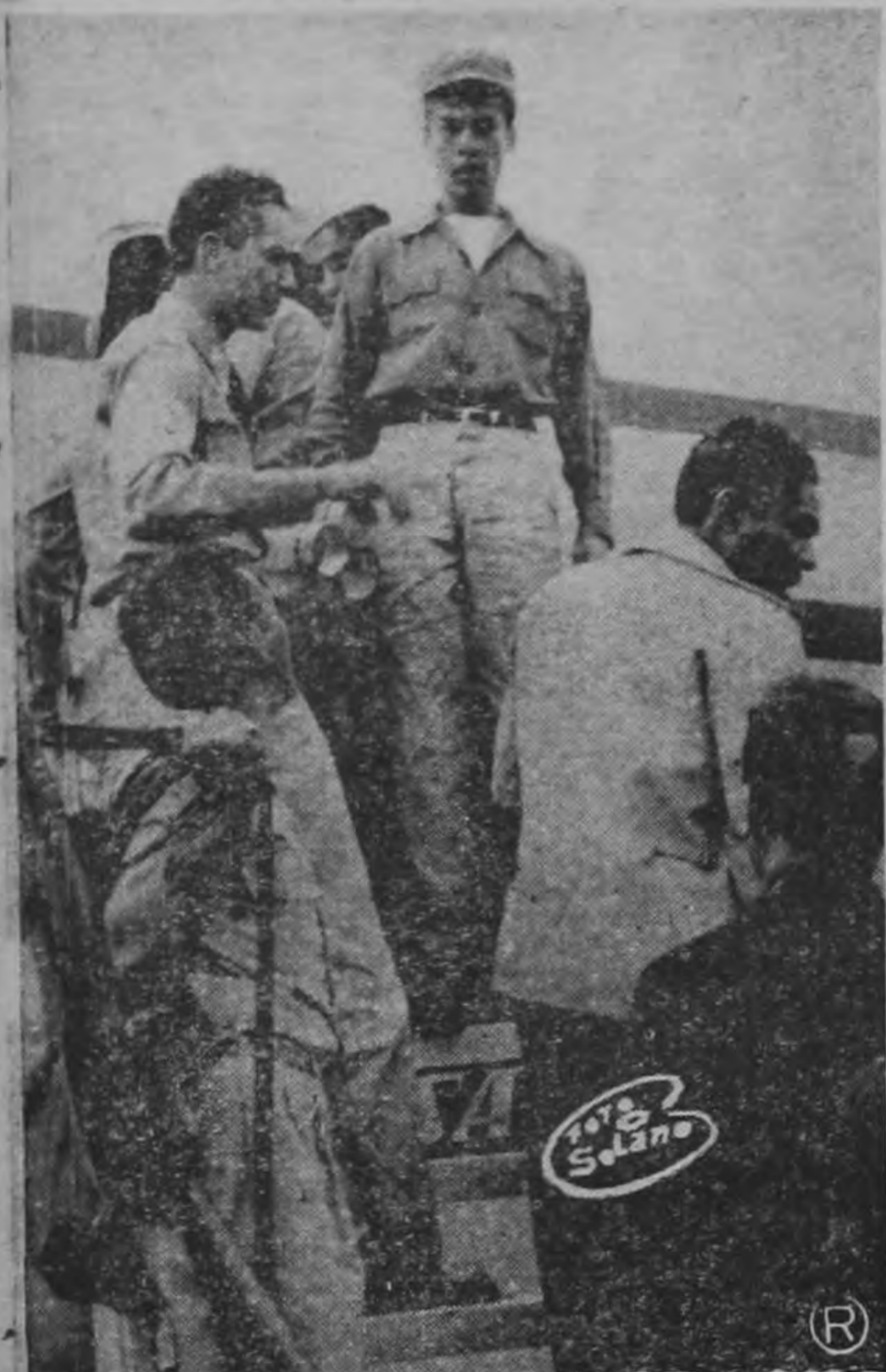
EL CORONEL QUIROS. —Durante la pasada emergencia de Los Chiles, el Jefe del Estado Mayor, Coronel Quiros, sube al avión bombardero en el cual voló sobre la zona que ocupaban los invasores. Fue este el principio de una acción que ha llenado de gloria al país entero.

Después de la ceremonia Nixon cambió de manos con el mundo". Saludó así a muchos obreros pidiéndoles que transmitieran sus saludos personales a sus compañeros. Su manera cordial causó gran impresión y uno de los obreros cubanos señaló: "Es muy democrático, le da la mano a todo el mundo".