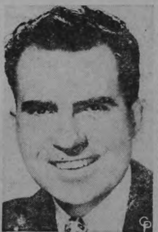
Sen. Richard Nixon

Es el americano que más joven ha llegado a Vice Presidente de los Estados Unidos. Su vida ha sido un constante esfuerzo de superación y estudio. Ofrecemos algunos datos sobre la vida de Richard M. Nixon que llegará a Costa Rica el 21 de este mes.