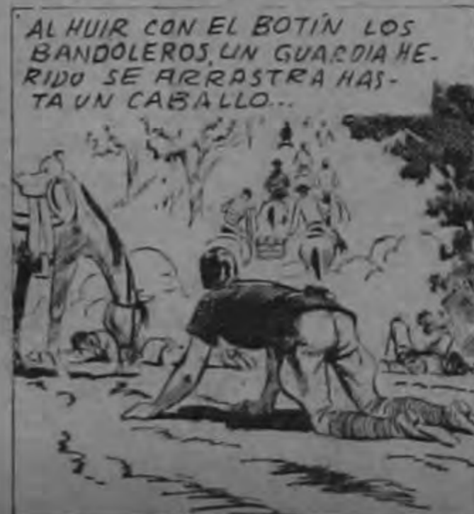
ALHUIR CON EL BOTÍN LOS BANDOLEROS, UN GUARDIA HERIDO SE ARRASTRA HASTA UN CABALLO...