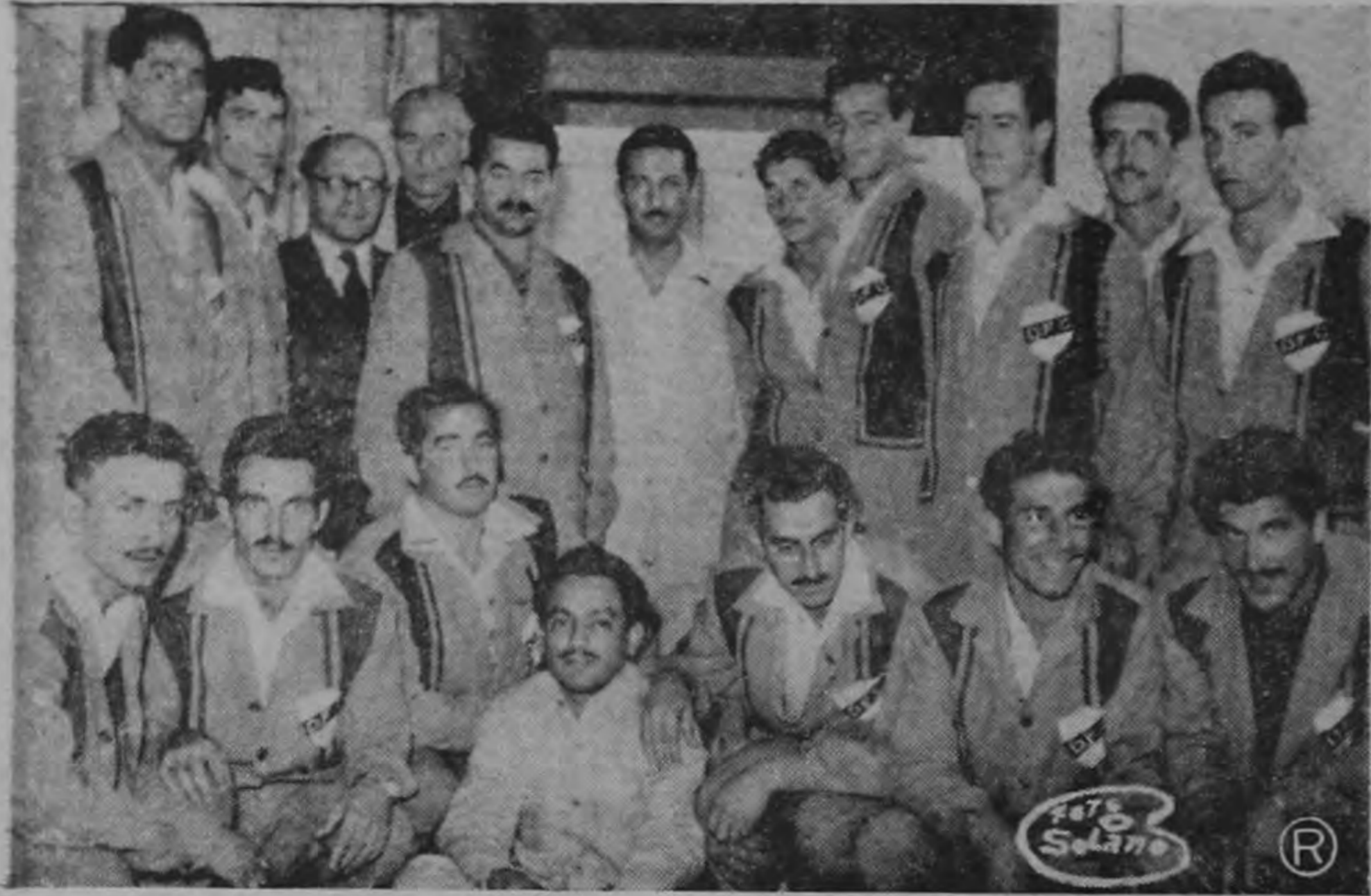
Jugadores que integran el equipo Danubio del Uruguay que llegó ayer y que se enfrentará esta noche al Alajuelense.

Ayer llegó la delegación del Danubio, sub-campeón del Uruguay y esta noche se enfrentará en el Estadio Nacional al Alajuelense reforzado.